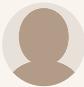
台湾から パネリスト招聘を 調整中

1941年京都市生。64年早稲田大学政経学部卒、朝日新聞社入社。68年から防衛庁担当。82年朝日新聞編集委員。著書多数。