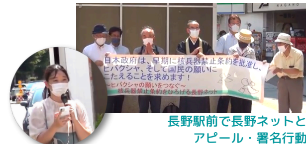
長野駅前で長野ネットと アピール・署名行動